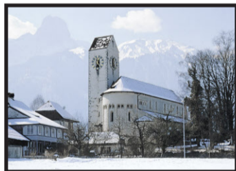
Amsoldingen mit Stockhorn.

Noch stehen wir aber am Bahnhof Interlaken, wo unser Wanderweg beginnt. Wir gehen