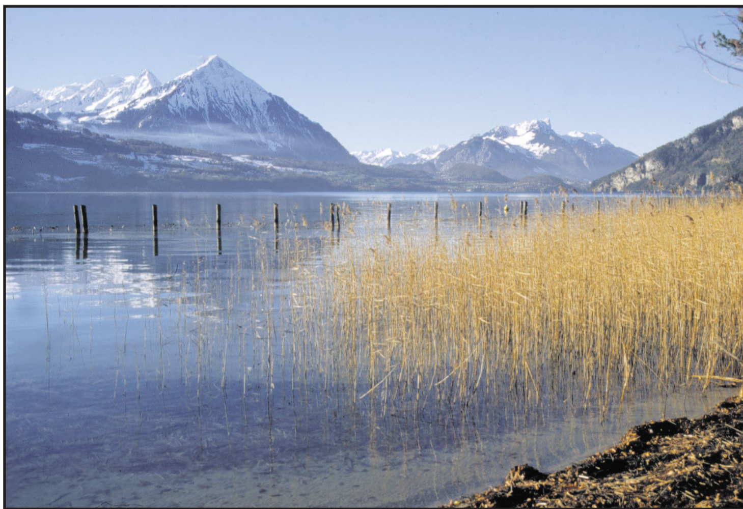
Prächtiger Blick auf den Niesen, die imposante «Pyramide» am Thunersee.

Startpunkt ist der Bahnhof Interlaken West. Ein amüsantes Detail ist, dass die Stadt auf dem «Bödeli» zwischen Thuner- und Brienzensee zusätzlich einen